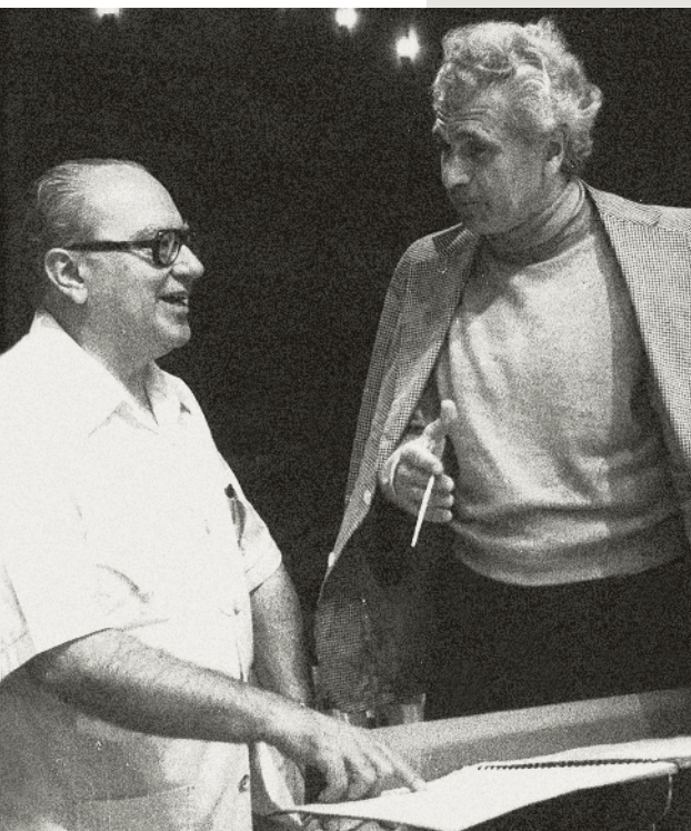
Ginastera and conductor Julius Rudel / Ginastera mit dem Dirigenten Julius Rudel

** Indicates a work with territorial restrictions (see disclaimer on pg. 33)